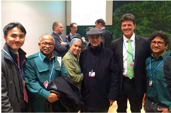
Links: Oud-premier Abdullah Ahmad Badawi, na het bijwonen van onze presentatie, samen met andere Maleisische bezoekers. Hij toonde zeer grote belangstelling om onze methoden in Maleisië toe te passen.