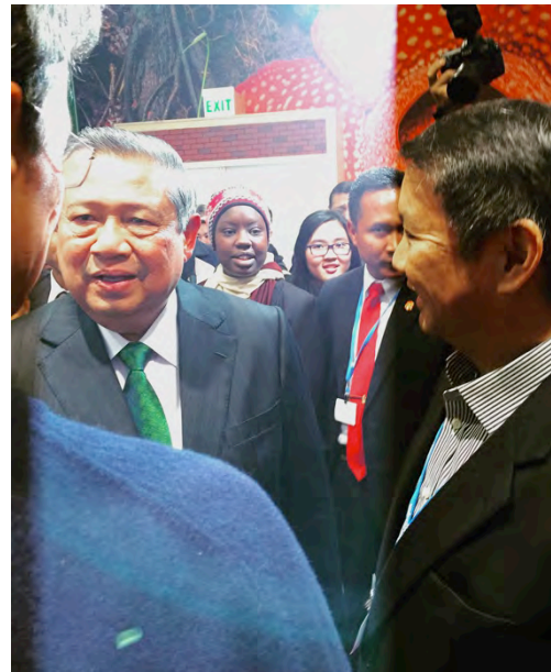
Aan de rechterkant met de voormalige president Susilo Bambang Yudhoyono en zakenman Hashim Djojohadikusumo, over suiker palmen en zijn steun voor het openen van de Masarang palmsuiker fabriek in Tomohon.