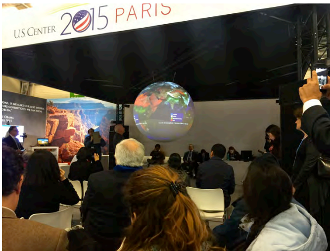
Onder: De ontzagwekkende wereldbol in het Amerikaanse paviljoen. Mooie en hele enge presentaties van de processen van de aarde in ruimte en tijd. Het is een kleine wereld!d!