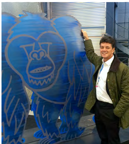
Links met één van de boog van Noach sculpturen waarmee de zaal in Parijs was ingericht. Hoop dat de orang-oetans dra minder reden hebben om blauw te zien.....